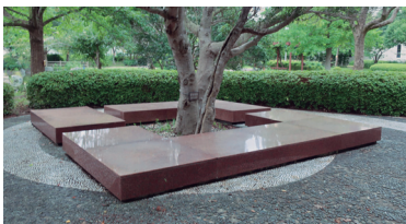
㊦鳴門教育大学 （学章を模したベンチ）