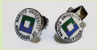
学章をあしらった記章 大学会館で購入可能（税込 200 円）

1981(昭和56)年 鳴門教育大学 創設 1984(昭和59)年 大学院学校教育研究科 1期生入学 1985(昭和60)年 学章のデザインを学内（教職員・学生）に公募 （応募作品39点の中に入選作品無し） 1986(昭和61)年 江藤徳島大学教授ら（当時）に協力いただき，制定 学校教育学部 1期生入学 2008(平成20)年 「鳴門教育大学学章等に関する要項」を制定 （学章・学称ロゴデザイン，基準色等を定める）