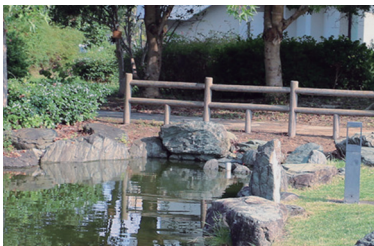
ほりこしはし ②堀越橋をイメージした欄干