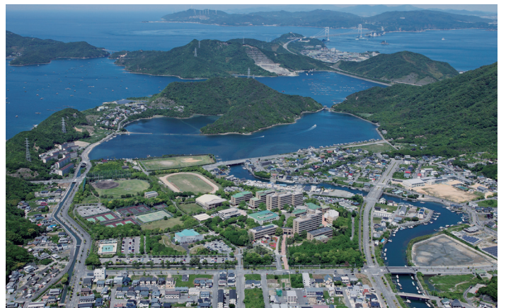
鳴門教育大学と瀬戸内海国立公園

学歌は、公式ウェブページ ( http://www.naruto-u.ac.jp/information/02/003.html ) 及び YouTube で聴くことができます。