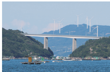
②堀越橋（1971（昭和46）年 架橋）